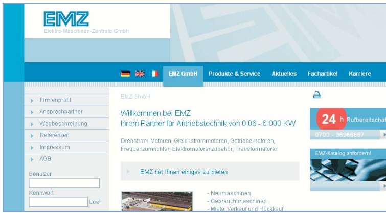
otrisCONTENT: Personalisierte Unternehmensportale für Interessenten, Kunden und Mitarbeiter