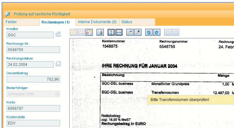
otrisDOCUMENTS: Komplexe Vorgänge effizient und papierlos durch das Unternehmen leiten